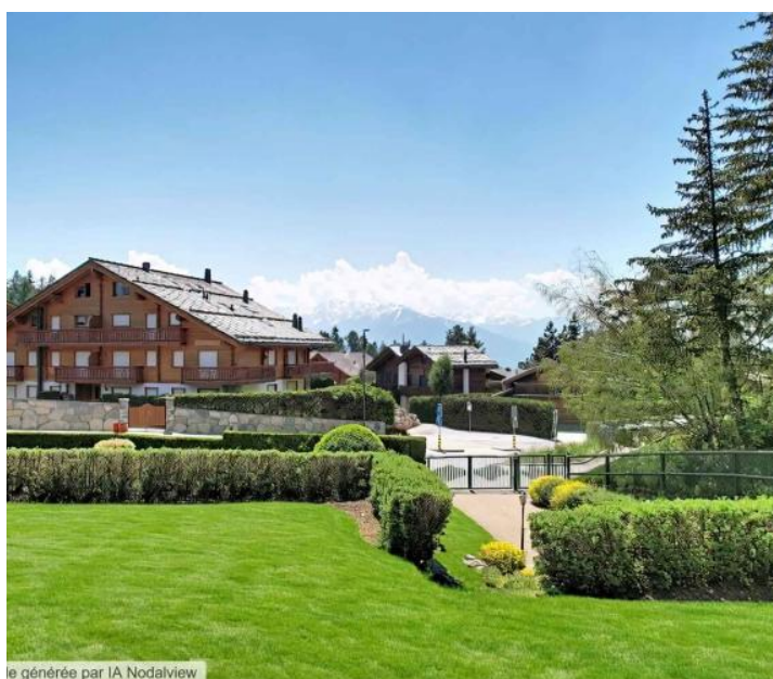
Image générée par IA Nodalview