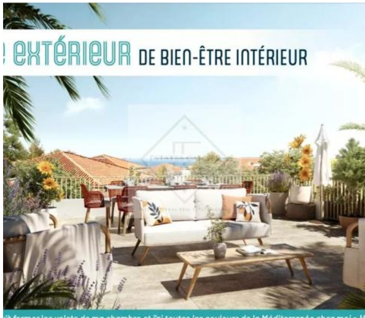
Qu'il ferme les volets de ma chambre et j'ai toutes les couleurs de la Méditerranée chez moi.